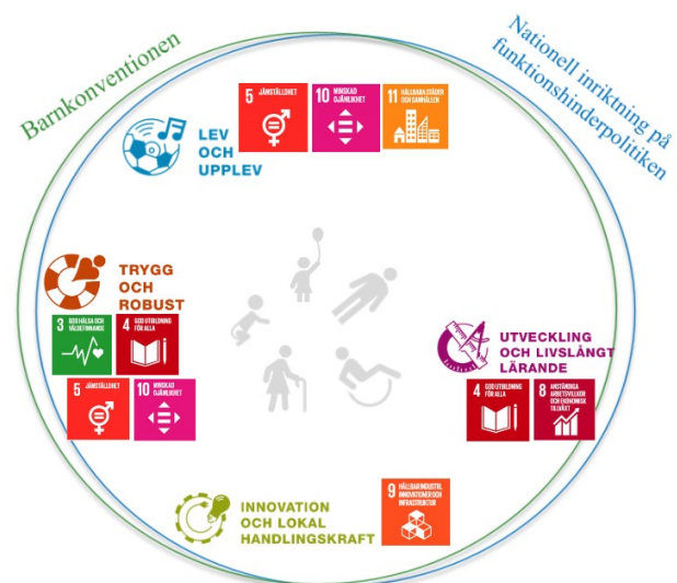
Figur 1 Utgångspunkter för Åtvidabergs kommuns funktionshinderpolitiska riktlinjer

Syftet med de funktionshinderspolitiska riktlinjerna är att skapa förutsättningar för att de kommunala, nationella och internationella målen ska nås. Genom att arbeta med riktlinjerna kan