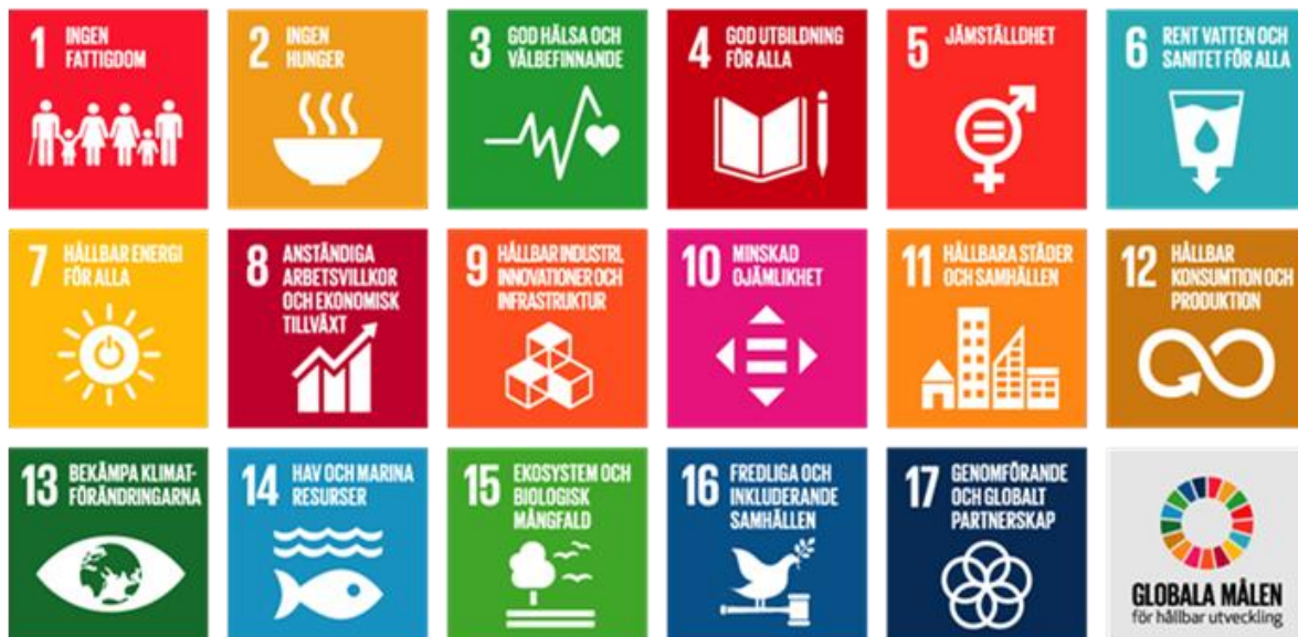
Figur 2: De 17 globala utvecklingsmålen, Agenda 2030.