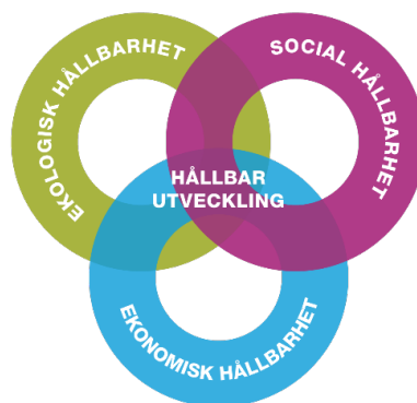
Figur 1. De tre dimensionerna för hållbar utveckling

Vi lever idag i ett globalt samhälle och saker vi gör här i Åtvidaberg kan få effekter på andra sidan jorden – både på gott och ont. Kommunen är en stor organisation som verkar inom många olika områden och har därmed även ett stort ansvar i att vara med och bidra till en hållbar utveckling för alla. En hållbar utveckling brukar definieras som "en utveckling som tillfredsställer dagens behov utan att äventyra kommande generationers möjligheter att tillfredsställa sina behov" (UN:s WCED, 1987). En hållbar utveckling består av tre dimensioner; ekologisk hållbarhet, social hållbarhet och ekonomisk hållbarhet. För att utvecklingen framåt ska kunna vara hållbar måste hållbarhet uppnås inom alla tre dimensionerna. De tre dimensionerna måste också hela tiden samverka och förhålla sig till varandra för att kunna bidra till en hållbar utveckling.