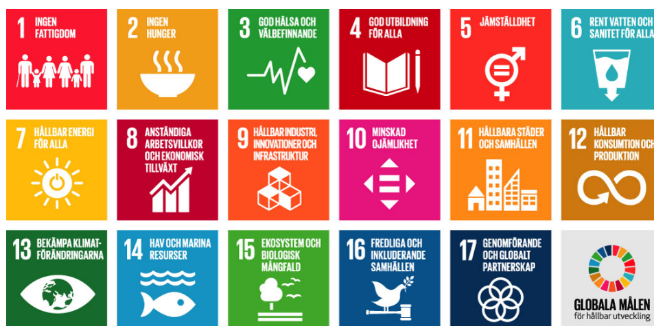
Figur 2. De 17 globala målen för hållbar utveckling.

I september 2015 lanserade FN Agenda 2030 och de globala målen för hållbar utveckling. Agenda 2030 är en utvecklingsagenda som består av 17 globala mål samt 169 delmål. I agendan tas ett helhetsgrepp kring hållbar utveckling och man betonar att de tre olika perspektiven är lika viktiga och ömsesidigt beroende av varandra. Sverige är ett av de många länder i världen som har antagit de 17 globala utvecklingsmålen och nu måste de implementeras nationellt, regionalt och lokalt för att de ska kunna uppfyllas.