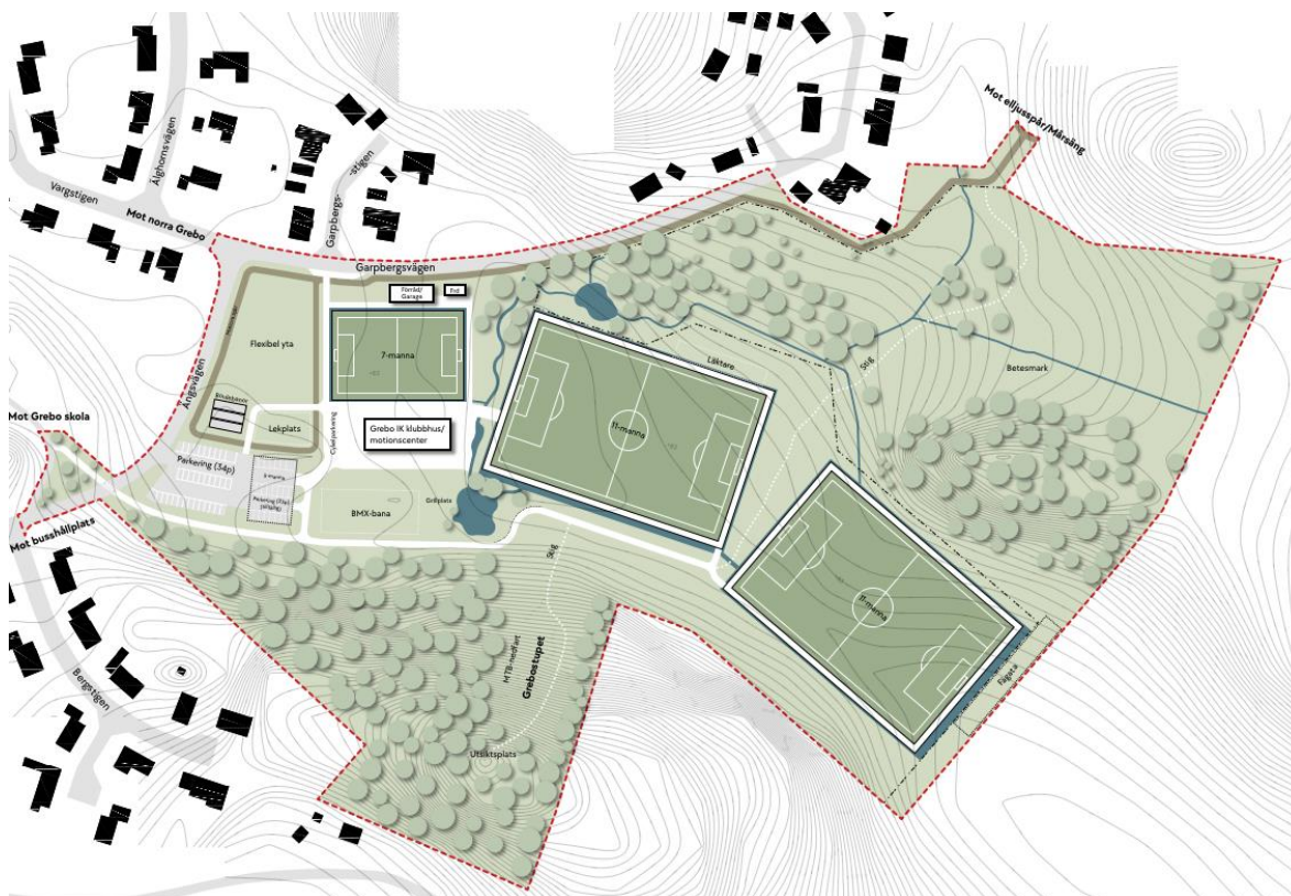
Figur 3. Illustrationsplan över planerad idrottsplats.

Åtvidabergs kommun upprättar en detaljplan för idrottsplatsen vilken kommer att nyttjas av Grebo IK. Den nya idrottsplatsen planeras innehålla ytor för olika typer av sport och aktiviteter. Exakt hur idrottsplatsen kommer att användas av kan Åtvidabergs kommun inte styra i detaljplaneskedet men den illustrationen som ligger till grund för planförslaget anger hur idrottsplatsen är tänkt att nyttjas, se Figur 3. Illustrationen visar förslag med fotbollsplaner, BMX-bana, boulebana, lekplats, MTB-bana, motionsspår, grillplats samt en flexibel yta. Det är dock endast fotbollsplanerna som är bestämt redan i planskedet, övriga ytor är endast ett förslag på aktiviteter av friluftskaraktär som kan vara lämpligt. Utöver fotbollsplanerna kommer området att planläggas som en flexibel yta som kan nyttjas och ändras utifrån vad som efterfrågas.