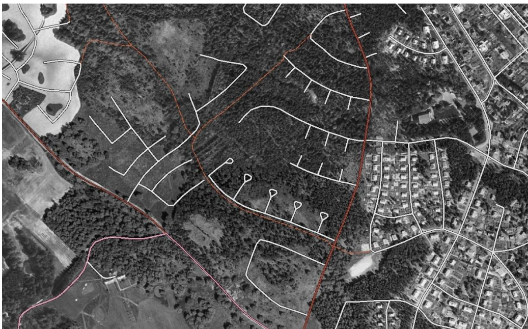
Figur 3: På detta flygfoto från 1963 är nuvarande gator och GC-vägar inritade. Kärrret som senare är utfyllt framträder mitt i bild. Det kan vara spår av torvtäkt som syns där den nuvarande fotbollsplanen är belägen.