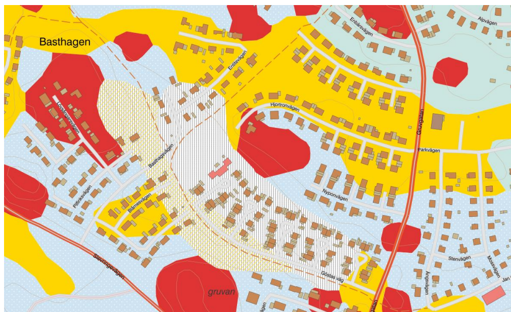
Figur 1: Jordartskarta med två markeringar för fyllning vid Göstas park och Basthagsvägen/Entitevägen i Åtvidaberg. I övrigt är blått sandig morän, gult är glacial lera och rött är urberg (SGU 2020a).

Område med fyllning är grovt räknat cirka 60 000 m 2 , varav cirka 45 000 m 2 utgör den huvudsakliga fyllningen mot norr-öster på kärtrtorv med underliggande lera och cirka 15 000 m 2 fyllning mot söder-väster direkt på ett tunt lager fast lera på morän som möjligen inte ska ingå här, se figur 1.