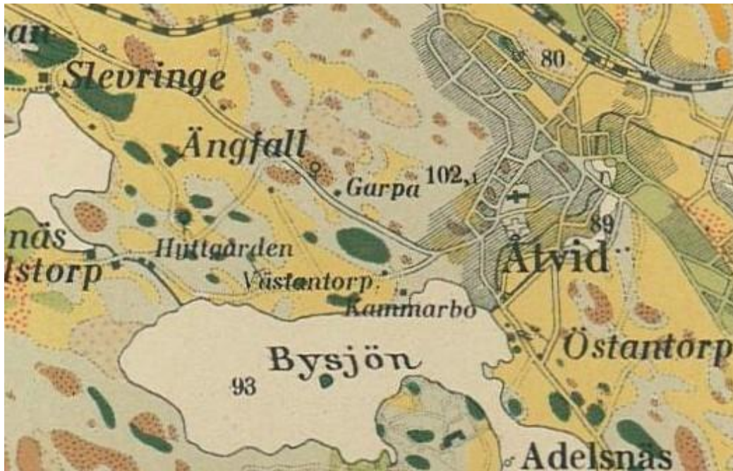
Figur 2: Ett utsnitt från den geologiska kartan från 1924 visar ett område med kärrtorv mitt i bildens övre del strax norr om Garpagruvan där Göstas park nu ligger.

Här fanns en dalgång med delvis trädbevuxet kärr där det längre tillbaka enligt uppgift har bedrivits viss torvtäkt, se figur 2 och 3.