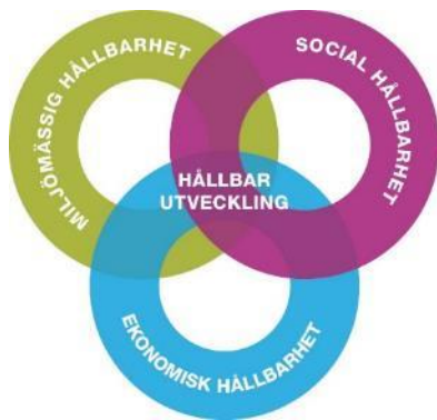
Figur 1. De tre dimensionerna som tillsammans leder till en hållbar utveckling.

Den miljömässiga dimensionen handlar om naturmiljön. Den miljö och de naturresurser som finns på planeten är de vi har att röra oss med. Vi kan inte utöka den miljömässiga dimensionen utan endast förvalta de naturresurser vi har på olika sätt. Förvaltar vi våra naturresurser på ett hållbart sätt kan vi säkerställa att de finns kvar för kommande generationer.